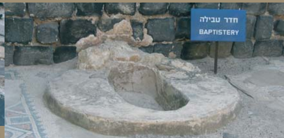
חדר טבילה

ומטפלים אלטרנטיביים, הטוענים לאנרגיות מופלאות במקום (ראו מסגרת). הכיסא, שמכונה "הספסל המכושף", התפרסם בעולם כולו כמקום שמייחסים לו סגולות מיוחדות: הוא משרה רוגע מיוחד על היושב ומקדם התגשמות משאלות לב, בעיקר משאלות פרויון.