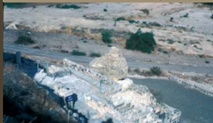
האמונה הנוצרית קושרת את נס החזירים לסלע הבולט על צלע ההר, צילום: פרופ' וסיליוס צפיריס