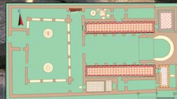
תרשים הכנסייה

ע מק כורסי נמצא בצדה המזרחי של הכנרת, על הדרך המובילה מעין גב לצומת יהודיה, בפתחו של נחל סמך היורד מרמת הגולן. עמק זה התברך באדמה חקלאית פורייה, שסביבה גבעות מוריקות ששיפוליהן טובים למרעה, ולמרגלותיהן חופי דיג עשירים. המקום האידיאלי לצמיחת כפרים חקלאיים משגשגים, ואכן, כבר בימי קדם היתה נוכחות אנושית באזור, שהגיעה לשיאה בתקופה הביזנטית, במאות 5-7 לספירה, עת הוקם בעמק מנזר מבוצר גדול, בעל אופי דתי מובהק.