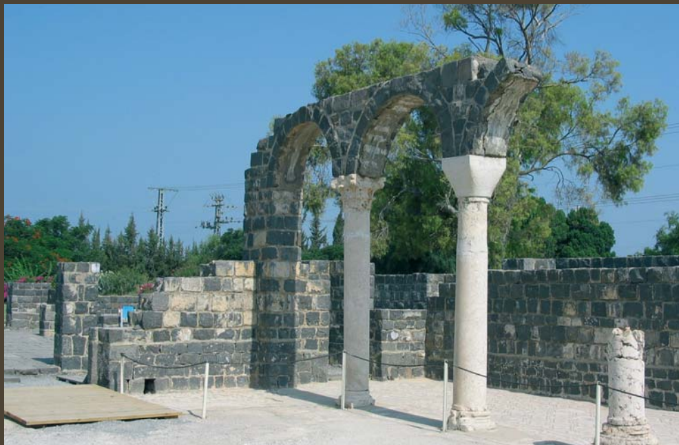
לאחר החפירות שוחזרו חלקים ניכרים של הכנסייה

על המצוק, מעל הכנסייה, נמצאו שרידי מגדל קטן וגוש סלע גדול בתוכו. המגדל התברר ככנסייה קטנה ויפה, מרובת פסיפסים, עמודי בזלת וקישוטים ארכיטקטוניים אחרים, שנבנתה כאתר פולחני סביב הסלע שמציינו, על פי אמונת המקומיים, את המקום שבו אירע נס החזירים. גילויים אלה מעידים יותר מכל על התפתחותה הגדולה של האוכלוסייה הנוצרית לאורך חופי הכנרת, אולם לא לאורך זמן. בשנת 614 לספירה, כלומר מעט לפני תום התקופה הביזנטית, פלשו לארץ צבאות הפרסים. את ירושלים הם הכו ללא רחם והיו אחראים לאחד ממעשי הטבח הגדולים בהיסטוריה המקומית. על פי המקורות, נרצחו בעיר כ-60 אלף נוצריים, וכך התחלפה כל אוכלוסיית ירושלים הנוצרית באוכלוסייה חדשה. הסיפור נשכח אי שם בין זוועות ההיסטוריה, אלא שבראשית שנות ה-90