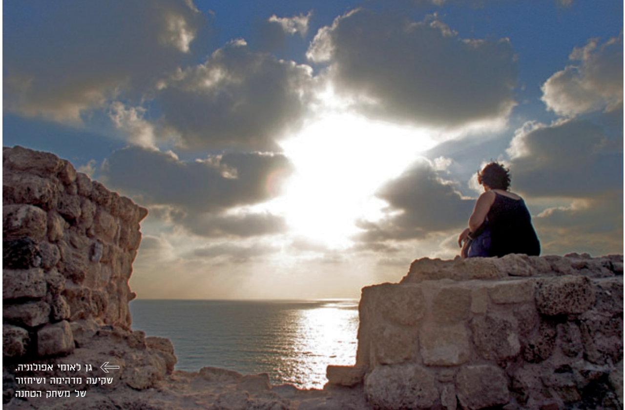
← גן לאומי אפולוניה. שקיעה מדהימה ושיחזור שני משחק הטחנה

לרוב, מוקמו המוקדים החברתיים בצמתי דרכים מרכזיים ביישוב: סמוך למדרגות המקדש, לשוק או למבני ציבור שונים. בטחנת הקמח המקומית, למשל, צריך היה כל אדם להמתין כמה ימים לתורו. בזמן ההמתנה לטחינה ריכלו, סיפרו בדיחות וגם שיחקו.