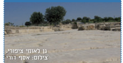
גן לאומי ציפורי, צילום: אסף דורי

בגן הלאומי בית גוברין, על עמוד שיש שפוצל לשניים על ידי הצלבנים כך שהפך לשולחן, אפשר למצוא את משחק הטחנה חקוק באבן בצורה בולטת מאוד. בגן לאומי אפולוניה הכין צוות האתר כמה אבנים שקווי משחק הטחנה נחרתו עליהן לא מזמן. בתקופות של פעילות לקהל הרחב, תוכלו ליהנות גם מהדרכה מתאימה.