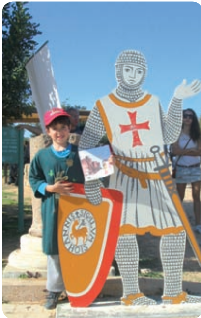
אני פקח צעיר

כתיבה: מערכת רשות הטבע והגנים