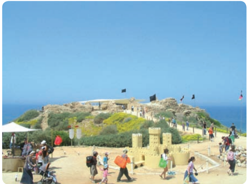
מסיירים ולומדים בגן לאומי אפולוניה

התצפית, ומבצר צלבני השוכן במרומי מצוק הכורכר ומשקיף על הים מגובה 30 מטר. בראש המבצר יש מרפסת תצפית מרהיבה המשקיפה על קו החוף מחדרה בצפון ועד לאשדוד בדרום.