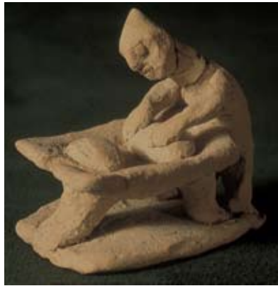
צלמית חרס של אשה לשה בצק מאה 6-8 לפנה"ס

הראשון (1104 לסה"נ). הסולטן הממלוכי בייברס כבש את אכזיב בשנת 1271. מאז היה כאן כפר קטן בשם א-זיב, ששמו שמר על צליל השם של היישוב הקדום. נראה כי בתקופה זו עברו התושבים להשתמש בנמל שנמצא במפרץ שמדרום לתל, שנודע בערבית בשם מינת א-זיב (נמל אכזיב). רוב השרידים שנראים כיום בשטח, כולל מבנה המסגד, נותרו מן הכפר הערבי הנטוש א-זיב ומהמבצר הצלבני שהיה כאן.