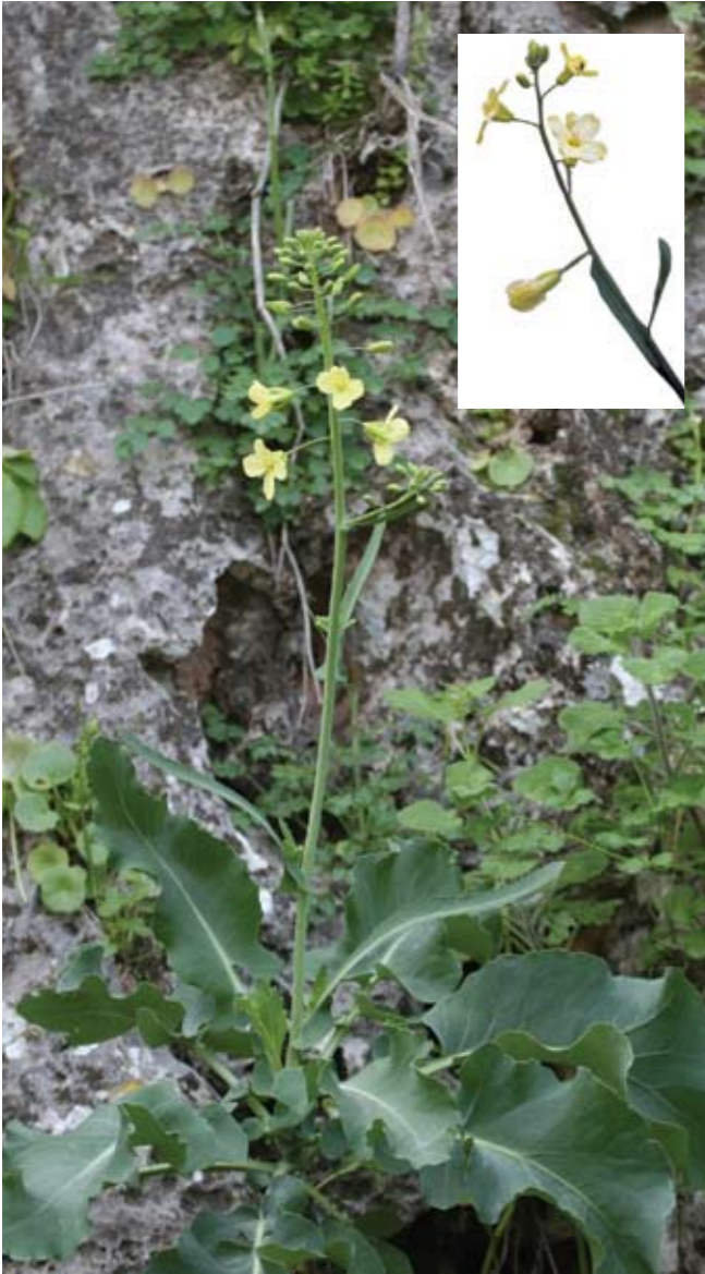
כרוב כריתי Brassica cretica – צמח רב-שנתי מעוצה בבסיסו הגדל במצוקים, ואחד מאבותיו הקדומים של כרוב היגיה.

פארק הכרמל: הגן הלאומי ושמורת הטבע יוצרים רצף של שטחים ירוקים, הכולל יותר מ-100,000 דונם של שטח פתוח טבעי. הפארק כולל מסלולים לטיולי רכב, שבילים לטיולים רגליים, חינונים למנוחה ולפיקניק ונקודות תצפית לנף.