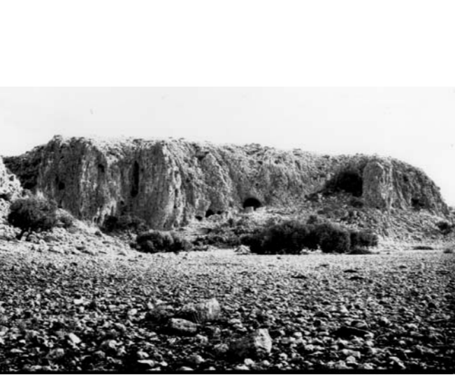
מצוק נחל מערות, 1929 – לפני החפירות (באדיבות רשות העתיקות)

מערות האדם הקדמון בכרמל נחפרו לראשונה בשלהי שנות ה-20 של המאה ה-20 בידי משלחת אנגלית בראשות החוקרת דורותי גָאָרְד. בסוף שנות ה-60 חפרה במערת התנור משלחת ארכיאולוגים מארצות הברית, ומאו חופרים במקום ארכיאולוגים מאוניברסיטת חיפה.