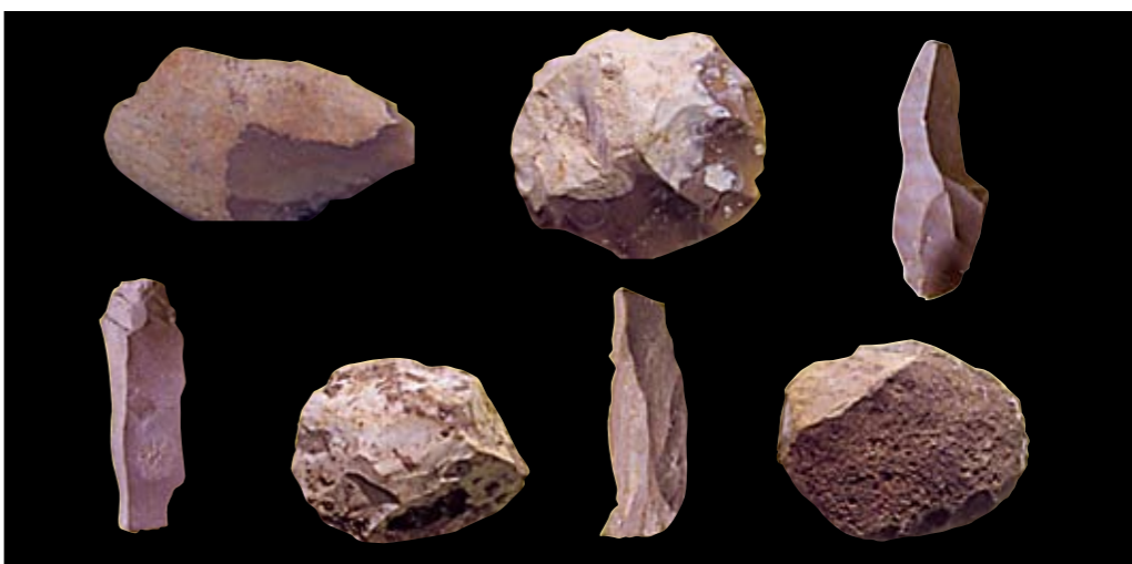
כלים מסותתים מאבן צור מתרבויות פרהיסטוריות שונות

מסביב למצפה הוקם חניון של הקרן הקימת לישראל. מן המצפה נשקפים נופי הכרמל ומישור חוף הכרמל. אפשר לשוב בשביל המסומן בירוק, אך מומלץ להאריך את הדרך ולשוב בשביל שמוביל מהמצפה מזרחה ומסומן בשחור. בהמשך הדרך