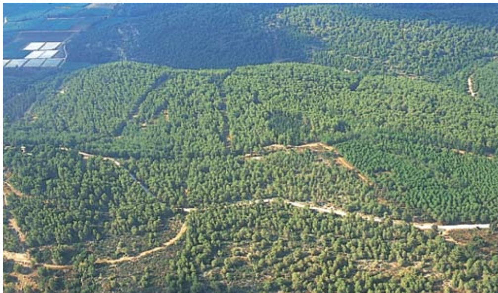
נוף הכרמל ממצפה עופר

במערה זו התגלה בית קברות של האדם המודרני (הומו סאפיינס) מלפני כ-100,000 שנים (זמנה של התרבות המוסטרית), כמו קבורת האדם הניאנדרטלי ממערת התנור. השלדים הקבורים במערת הגדי הם אחת העדויות הקדומות בעולם לנוכחות אדם מודרני מחוץ לאפריקה (שם התפתח לפני כ-200,000 שנים). לסת שלמה של חזיר בר הונחה על בית החזה של אחד הנקברים, ומפורשת כמנחת קבורה קדומה. קונכיית ימיות שנלקטו ועובדו לחרוזים וכן גושי מינרל צבעוני (אוכרה) ששימש, אולי, לעיטור הגוף, נמצאו בהקשר לקבורות. ממצאים אלה, מהקדומים בעולם בסוגם, מצביעים על התנהגות אנושית "מודרנית" ועולם סמלים מפותח כבר לפני זמן רב ומתאימים לזיהוי השלדים עם האדם המודרני הקדום.