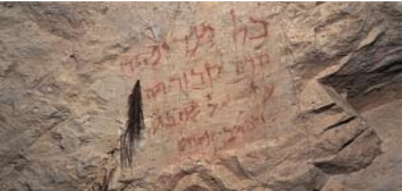
כתובת ארמית במערת הקללות

השביל מגיע לחצר, וממנה יורדים שמאלה בגרם מדרגות אל מערת יהודי סוריה ואל מערת הקללות (12). במערת הקללות, הנמצאת ממול, יש ארבעה אולמות. על אחד מקירות המערה חרותה דמות נשר. במערה יש גם 12 כתובות ביוונית ובארמית, שאחדות מהן מכילות קללות כגון "כל מן דיפתח הדא קבורתא... ימות בסוף, ביש".