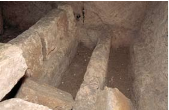
קברו המשוער של רבי יהודה הנשיא

מערת רבי יהודה הנשיא (14) – זוהי מערכת קבורה גדולה הכוללת חצר, מערה ומבנה עילי. בכניסה למערה יש חזית מרשימה, בנויה משלושה פתחים ומעליהם שלוש קשתות בגובה שמונה מטרים. באולם הראשון, מצד שמאל, כתובת עברית בצבע אדום: "רבי שמעון". בפניה הדרומית של אותו אולם, על אבן, נמצא העתק של כתובת שנעלמה במשך הזמן: "אנינא [חנינא]