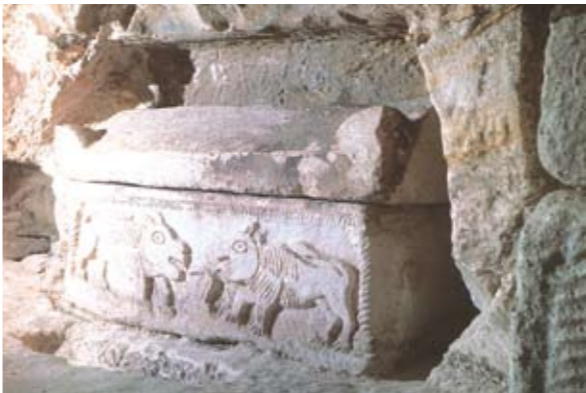
ארון האריות ממערת הארונות

מערת הארונות (20) – מערכת קברים גדולה ומרשימה שמידותיה 75x75 מטרים. גם למערה זו יש חזית מפוארת בעלת שלוש קשתות. במערה נמצאו 135 ארונות. עשרים מהם נושאים עיטורים נאים הלקוחים בעיקר