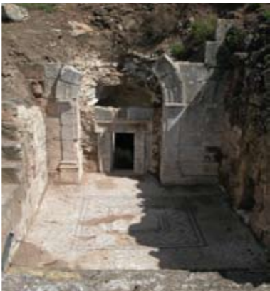
חזית מערת המאוזוליאום

מערת המאוזוליאום (11) – נמצאת בחלק העליון של מכלול המערות. לצד חזיתה התנוסס לתפארה מבנה מפואר, עשיר בתבליטים המתארים בעלי חיים. זה היה "נפש" – מבנה להנצחת מתים. המבנה קרס; חלק מאבניו נלקחו לתצוגה במערת המוזיאון וחלקן מסודרות בסמוך. מערה זו מצטיינת ברצפת פסיפס בחזיתה ובארונות אבן לצד קברי מקמרה.