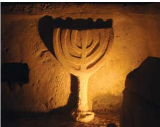
"אם כל המנורות" במערת הארונות

בשנת 2009 נפתח בגן הלאומי מתחם מערות נוסף – "מערות המנורה". זהו מתחם בן שש מערות קבורה שנמצא למרגלות הצד המערבי של גבעת בית שערים. מערות קבורה אלה עשירות בעיטורים, בחריתות, בכתובות ובתבליטים, ובהם עשרות תבליטים של מנורות שבעה קנים – סמלה של