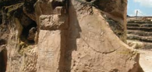
חריתות של ספינות במערת הגיהינום

מערת הגיהינום – כאן נמצאו חריתות של שתי ספינות סוחר, והן מעידות על ימאות עברית בעת העתיקה. יש כאן גם עיטורים גאומטריים חרותים בתוך פנלים מלבניים ושירי אָבָל בן 11 שורות משנת 900 לספירה. השיר, הכתוב בצבע שחור בשפה הערבית, נמצא בחפירות אך מאז נעלם.