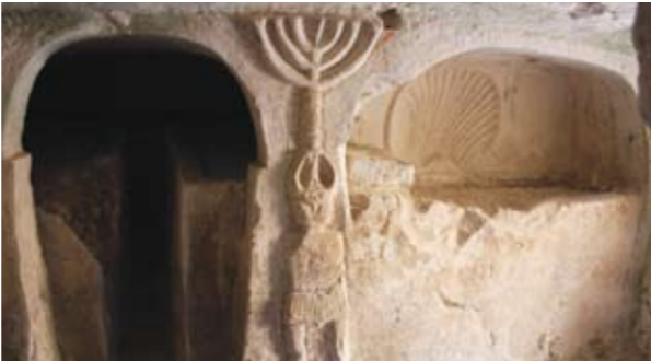
תבליט הלוחם ומנורתו

מערת הלוחם ומנורתו (3) – מערה בעלת חמישה אולמות וכשמונים מקומות קבורה. באולם המרכזי חקוקות כמה מנורות שבעה קנים ותבליט של קונכייה. המנורה המרשימה ביותר, בעלת שלוש רגליים, חקוקה על ראשו של לוחם. יד דונוית פגעה בה קשה, אך היא שוקמה בהצלחה. הכתובות במערה מעידות כי מוצא הנקברים היה מתדמור.