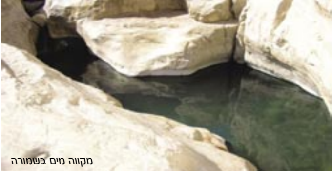
מקוה מים בשמורה

בסבך צמחי המים מקרקרות בקול אילניות – צפרדעים קטנות וחינניות, הניזונות מחרקים ומבלות בעיקר על גבי צמחים. צבען ירוק-צהוב-אפור ולצדי הראש שלהן משוך פס כהה. מבין שוכני המים נמצא גם קרפדות ונחשי מים לא ארסיים, שמחליקים בלי קול בתוך המים.