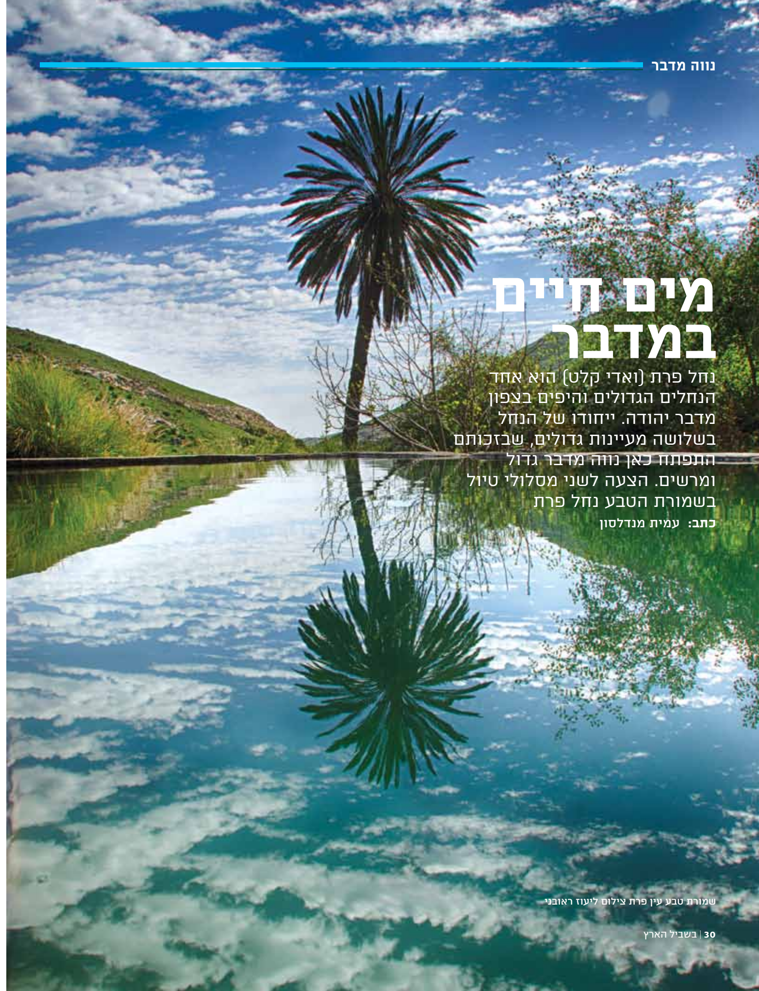
שמורת טבע עין פרת

נחל פרת (ואדי קלט) הוא אחד הנחלים הגדולים והיפים בצפון מדבר יהודה. ייחודו של הנחל בשלושה מעיינות גדולים, שבזכותם התפתח כאן נווה מדבר גדול ומרשים. הצעה לשני מסלולי טיול בשמורת הטבע נחל פרת כתב: עמית מנדלסון