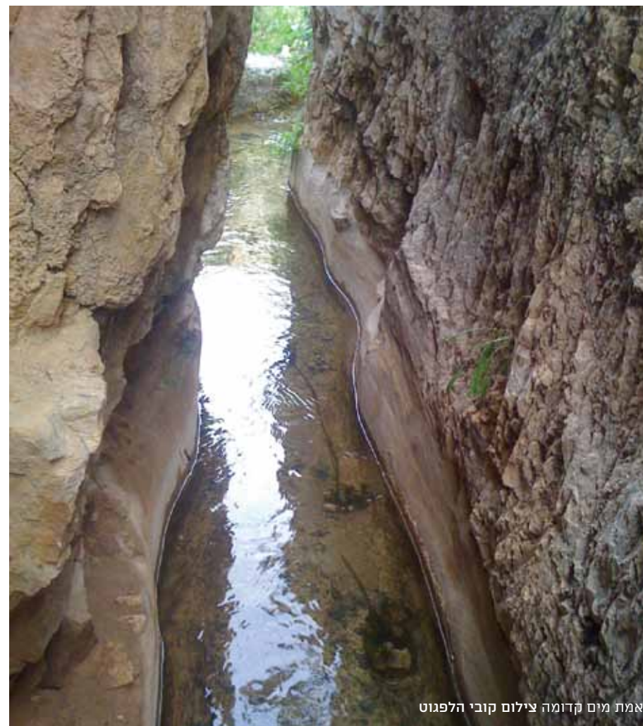
אמת מים קדומה

אופי המסלול: מעגלי, מתאים לכל המשפחה (אינו מתאים לעגלות ילדים), אורכו כ-1.5 קילומטרים תיאור המסלול: מגיעים ליישוב עלמון (ענתות) ונוסעים לפי השילוט בכביש צר ומפותל היורד לערוצו העמוק של הנחל. חונים בחניון העליון ויורדים לערוץ הנחל. כאן יש חורשת אקליפטוסים, שבה פונים שמאלה ועולים לאורך הערוץ עד לאזור המעיין עצמו. המים בוקעים מבין הסלעים ומזינים בריכות צלולות, ובצוקים שמעל נמצא מנזר פארן שבו נזירים בודדים דרים במערות טבעיות במצוקי הנחל. הם אינם