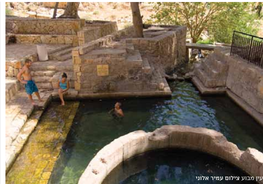
עין מבוע

משתמשים בחשמל ואינם אוכלים בשר. בלילה הם קוראים לאורו של נר שמן. הלחם שהם אוכלים נאפה במקום, ואת מימיהם הם שואבים מהמעייין. הכניסה למנזר פארן אפשרית בתאום עם המנזר. מהמעייין יורדים חזרה לחורשה. בצדה הצפוני של החורשה נמצאת בריכת התמר, בריכה עמוקה ויפהפייה, המושכת אליה מבקרים רבים (הכניסה ליודעי שחייה בלבד). לצד הבריכה נזהה שביל מסומן שחור, המטפס במתינות במדרון הצפוני וממשיך מזרחה לעבר האתר הארכיאולוגי חורבת עין פארה. בסקר ארכיאולוגי שנערך בשנת 1968, נמצאו במקום שרידים מתקופת הברונזה המאוחרת ומתקופת הברזל, המקבילות לתקופת התנחלות השבטים בארץ ישראל. הממצאים כללו חרסים, חומה גדולה ומתחם קבורה. על סמך הסקר, הוצע