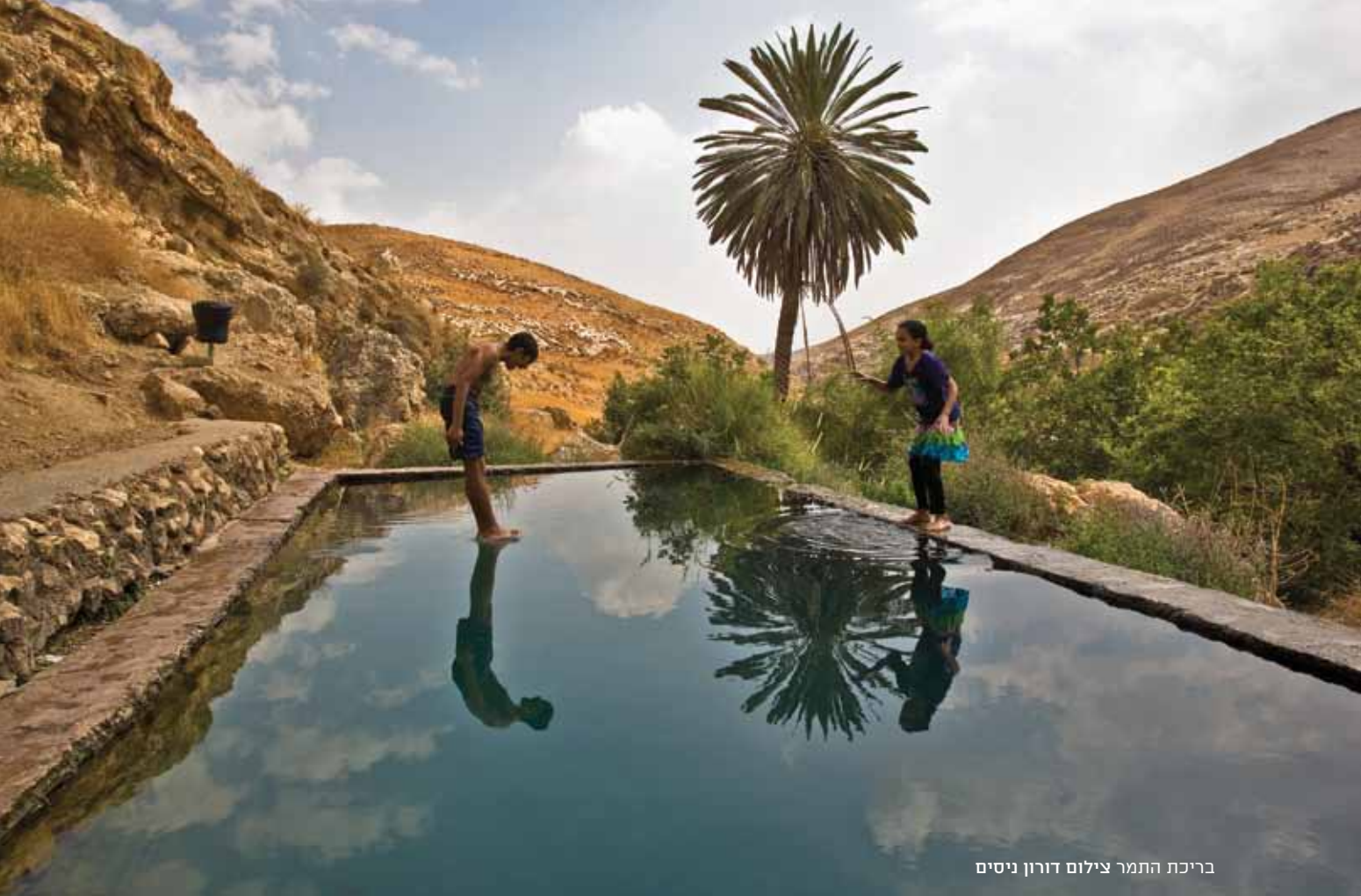
בריכת התמר

משתמשים בחשמל ואינם אוכלים בשר. בלילה הם קוראים לאורו של נר שמן. הלחם שהם אוכלים נאפה במקום, ואת מימיהם הם שואבים מהמעייין. הכניסה למנזר פארן אפשרית בתאום עם המנזר. מהמעייין יורדים חזרה לחורשה. בצדה הצפוני של החורשה נמצאת בריכת התמר, בריכה עמוקה ויפהפייה, המושכת אליה מבקרים רבים (הכניסה ליודעי שחייה בלבד). לצד הבריכה נזהה שביל מסומן שחור, המטפס במתינות במדרון הצפוני וממשיך מזרחה לעבר האתר הארכיאולוגי חורבת עין פארה. בסקר ארכיאולוגי שנערך בשנת 1968, נמצאו במקום שרידים מתקופת הברונזה המאוחרת ומתקופת הברזל, המקבילות לתקופת התנחלות השבטים בארץ ישראל. הממצאים כללו חרסים, חומה גדולה ומתחם קבורה. על סמך הסקר, הוצע