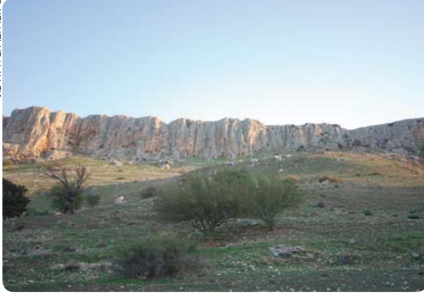
מצוק ארבל. כולל שמונה קבוצות של מערות - מבט מתוך נחל ארבל.