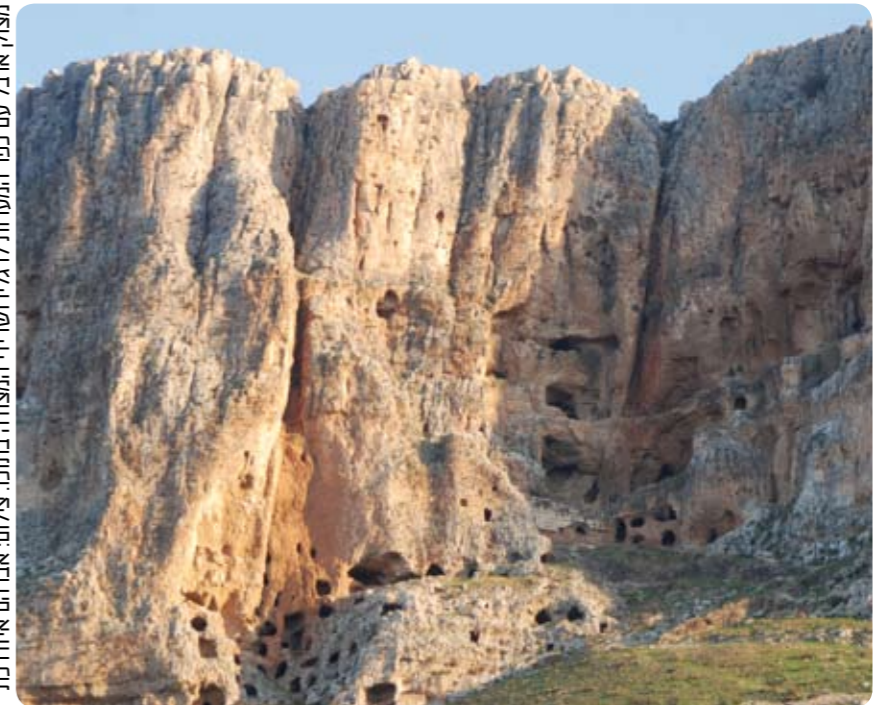
מצוק ארבל עם כפר המערות לגליל ושרידי המצודה בתוכו.

מסע אל אלפיים שנות היסטוריה בארבל שבגליל המזרחי מגלה סיפורי קרבות הרואיים של קנאים ומורדים שהתבצרו במצוקי ההר ונלחמו למען ביטוי העצמאות והגאולה. ממרד החשמונאים ועד להתיישבות היהודית החדשה. הארבל, כחממה לתחילת הגאולה