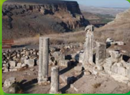
שרידי בית הכנסת (מתקופת התלמוד).

בתחילת המאה הראשונה התקומם כנגד הורדוס אנטיפס (יורשו של המלך הורדוס, מושל הגליל והפראיה) בציפורי, יהודה בן חזקיה, מייסד "הפילוסופיה הרביעית", מהוגי רעיונות הסיקריים (קבוצה קיצונית