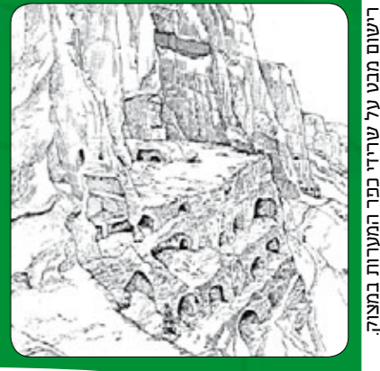
שרטוט: איור כהן רשום מבט על שרידי כפר המערות במצוק.

ראשיתה של ההתיישבות במערות שבצוק הצפוני של הר ארבל החלה בימי בית ראשון ואולי אף לפני כן. התיישבות מאסיבית החלה בימי החשמונאים, נמשכה בימי המלחמה הגדולה ברומאים, דרך התקופה הביזנטית ועד המאה ה"ז - ימי שלטון בית מען הדרוזי. בצוק הסלע של הר ארבל נחצבו או הותאמו לצורכי מגורים, יותר מ-120 מערות. המערות הללו מאורגנות בעשר קבוצות. משני צדיה של כל קבוצה יש זקפת סלע המקשה את הגישה למקום. לעתים יש שניים-שלושה חדרים במערה אחת. גובה החדרים הוא בדרך כלל שני מטרים. המערות חצובות במכלסים אחדים זה מעל זה, וגם כיום קשה להגיע אל העליונות שבהן. ככל הנראה הגיעו אליהן בזמנו בעזרת סולמות וחבלים, והיושבים בהן הרגישו מוגנים. נוסף למתקני המגורים נמנו ברחבי כפר המערות לפחות 25 מתקנים מטויחים, רובם לאגירת מים, ולפחות שלושה מהם נועדו לשמש מקוואות טהרה יהודיים. אלו כוללים שני חדרים (חדר קדמי וחדר טבילה). למקוואות ירדו במדרגות שגובהן 30 ס"מ ורוחבן 20 ס"מ. המצודה הראשונה במקום האסטרטגי - צופה על הדרך הראשית לדמשק, "דרך הים" - הוקמה כנראה על ידי הצלבנים ומזוהה כ"קאזלה טארדלה", ונמצאת לרגלי מצוק המערות.