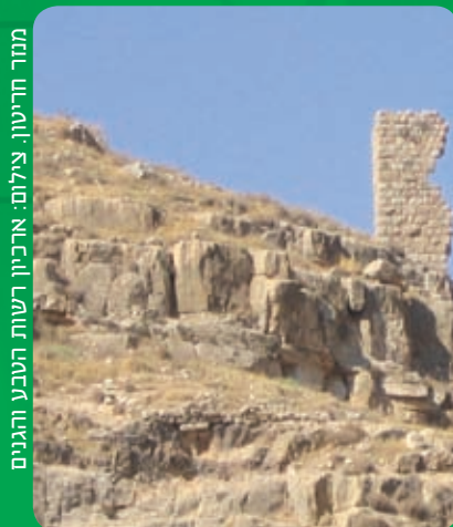
מזרח חריטון.