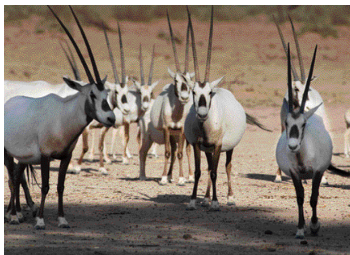
שועל פנק (מימין) וראמים לבנים (למעלה) בשמורת טבע חיבר יטבתה

(המילים: זמן, לווין, טבע, שני, רשות הטבע והגנים, כלוב, לב)