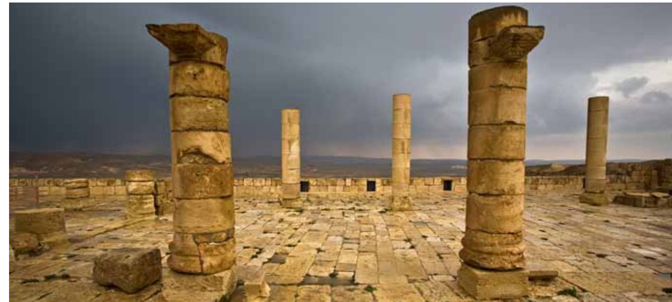
גן לאומי עבדת