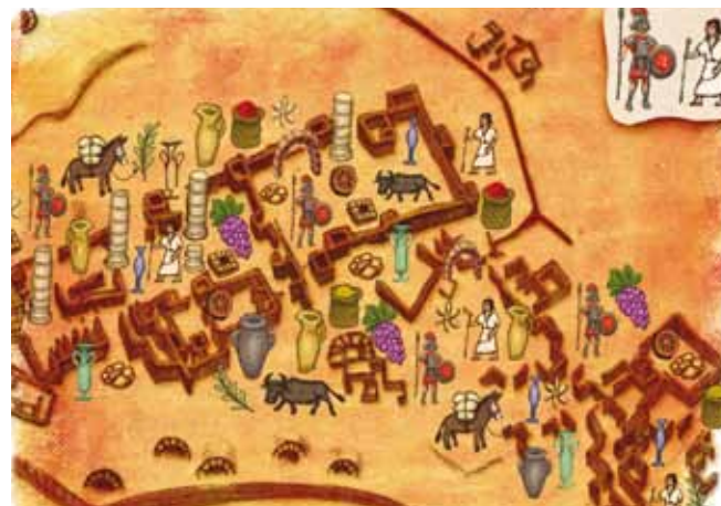
איור: ענבל שריד

בעיר עבדת נחצבו מערות רבות. מערות קרירות אלה שימשו לאחסון התוצרת החקלאית שגידלו תושבי המקום. בעלי העיניים החדות יבחינו בדמות של שור חצובה על קיר באחת המערות - השור סימל שפע ושגשוג. ואם כבר מדברים על עיניים חדות - לפניכם מפת עבדת. סמנו את הסוחרים הנבטים ואת החיילים הרומים החבויים במפה. כמה סוחרים יש וכמה חיילים?