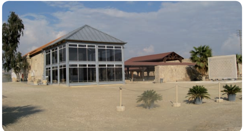
אתר השומרונים הטוב. אתר ארכיאולוגי מרשים