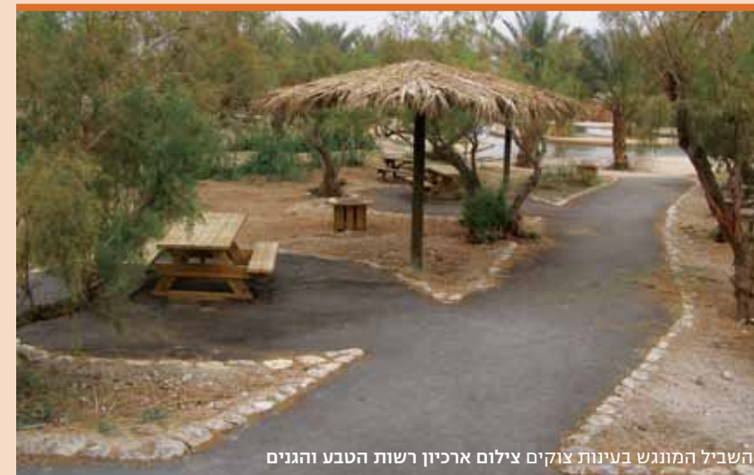
השביל המונגש בעינות צוקים

בין מצוק ההעתקים מזה וחופי ים המלח מזה פורצים מעיינות שופעים של מים חיים, הזורמים בפלגים צלולים אל המים המלוחים של ים המוות. בדרכם יוצרים המים אזור נרחב של אלפי דונמים - עולם עשיר ומיוחד של מגוון בתי גידול לחים. זוהי שמורת טבע עינות צוקים (עין פשח'ה). עצי אשל היאור ואשל מרובע עמידים למליחות והם שולטים ברוב השטח. קרוב יותר למים שולטת צמחיית גדות, שנציגיה הבולטים הם קנה מצוי וסוף מצוי. נפוצים מאוד גם סמר חד וסמר ערבי - שיחים בעלי גבעולים דקים וחדים. עולם החי מיוחד במינו. בפלגים ובבריכות שוחים ארבעה מיני דגים: