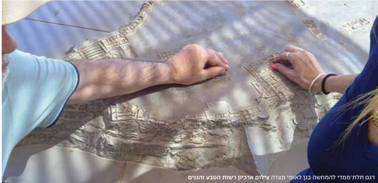
דגם תלת־ממדי להמחשה בגן לאומי מצדה

המקומות האלה אפשר להשאיר את כלב השירות במכלאה מיוחדת בכניסה לאתר. מידע מוקדם ונגיש: מסירת מידע מוקדם על הנגישות במקום מסייעת למטיילים להתכונן לבילוי בחיק הטבע. אתר האינטרנט של רשות הטבע והגנים הוא ערוץ תקשורת מרכזי עם הציבור. בימים אלה מתקיים תהליך שבסופו אנשים עם מוגבלות יוכלו לגלוש באתר בעזרת התוכנות המיוחדות שנמצאות ברשותם. כל גולש יוכל להתאים לעצמו את המסך האישי שלו (שינוי גודל האותיות וצורת הרקע בכל דפי התוכן שמיועדים לקהל הרחב). נוסף לכך, יתווסף לאתר האינטרנט לחצן נגישות שיוכל את הגולשים אל מידע מדויק ככל האפשר על הנגישות בכל אחד מאתרי הטבע והגנים הלאומיים ואל מוקד שירות ששייב לשאלות שלא קיבלו התייחסות מספקת באתר. רשות הטבע והגנים פועלת רבות לחיזוק המחויבות הערכית והרגשית של הציבור לנוף המקומי ולשימור וטיפוח של הסביבה הטבעית והמורשת הבנויה. כבר היום יש מסלולים מונגשים באתרים ברחבי הארץ, בהם תל דן, נחל שניר, חורשת טל, יחיעם, עין אפק, חניונים בכרמל, בית שאן, בית הכנסת העתיק בית אלפא, גן השלושה (הסחנה), קיסריה, בית ינאי, אפולוניה, מערת הנטיפים, עין חמד, בית גוברין, אשקלון, עבדת, מרכז המבקרים מכתש רמון, קומראן, עינות צוקים (ראו מסלול), עין גדי, מצדה, חוף האלמוגים באילת ועוד.