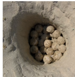
↑ קן של צבת ים עם ביצים

כולם התרגשו כל כך מהנושא וכל אחד סיפר מה שידע על צבי הים. אבא סיפר על הביקור שלנו במרכז הארצי להצלת צבי ים, ששם ראינו איך מטפלים בצבים פצועים עד שהם מחלימים ואז משיבים