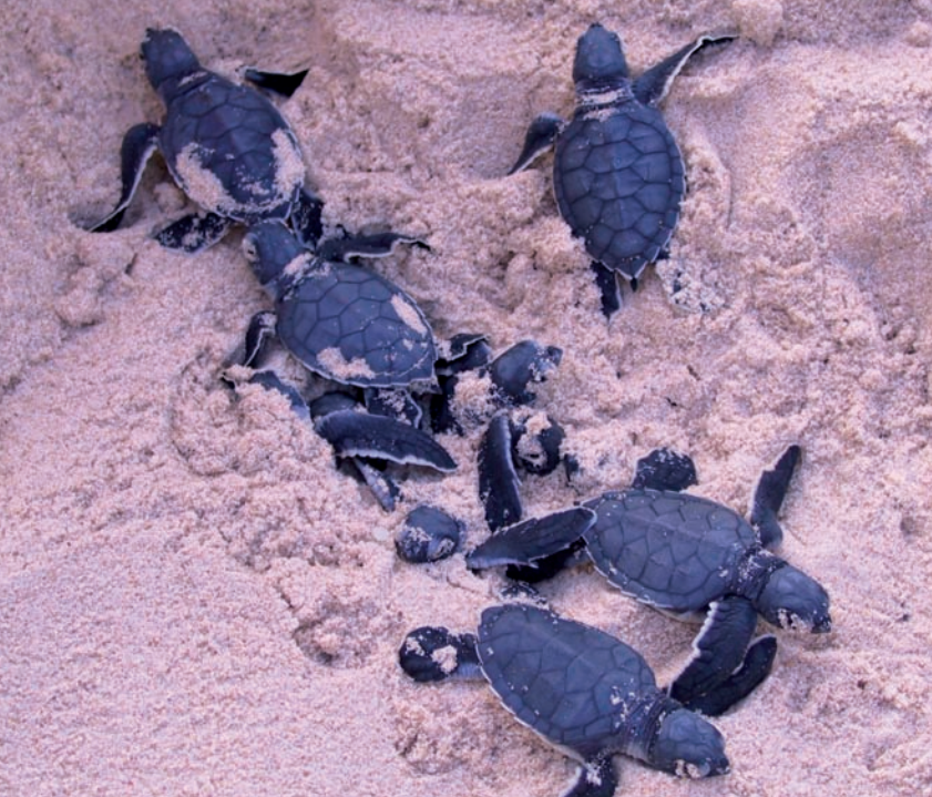
↑ צבונים שבקעו מהקן בדרך אל הים

ראיתי את מעיין מחשבת במהירות... "לאן נעלמו 15 ביצים?", היא שאלה בדאגה. "כאן בדיוק מתחיל החלק המרגש והמעניין ביותר של הסיור", אמרתי. "אחרי שלושה לילות, שבהם הגיחו ראשוני הצבים מן הקן, פותחים את הקן כדי לבדוק מה קרה ליתר הביצים שבו. רק לפקח מוסמך מותר לעשות את זה. מול עינינו ממש, פינה הפקח את החול והגיע אל פתח הקן. הוא חפר בעדינות את החול החוצה והוציא ממנו שבוי קליפות ביצים שמהן בקעו הצבים. הוא הוציא גם כמה ביצים שלמות והסביר שלא בכל ביצה מתפתח צב. תוך שהוא מסביר, ממשך וחופר, הוא הוציא מהקן שני צבים קטנים, תשושים ועייפים. כולנו שמחנו והתרגשנו מאוד כי הבנו שאם הוא לא היה מוצא אותם, הם היו מתים בקן מכיוון שהם לא היו מסוגלים לטפס החוצה בכוחות עצמם. באותו ערב הציל הפקח ארבעה צבונים קטנים. כולנו צפינו בו מלווה את הצבונים הקטנים אל הים ושומר שלא יאבדו את הדרך. "הסיור היה כל כך מעניין ומהנה שביקשתי מאמא ואבא שנרשם לסיור גם השנה", אמרתי. "גם אנחנו רוצים להצטרף", קראו מעיין, תמר ורותם במקלה. "איפה נרשמים?". "צריך להתקשר למוקד המידע של רשות הטבע והגנים - 3639*", ענה ארצי. "ולבקש להירשם לסיור בעקבות צבי הים, שם תקבלו את כל המידע - מתי יתקיימו סיורים ואיפה". "עכשיו אפשר להסכים שמפסלים צבת ים?", שאלתי בחיך. "בוודאי", ענו כולם יחד וצחקו.