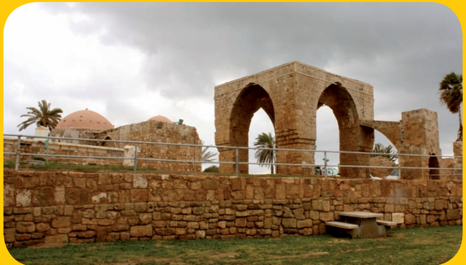
גן לאומי אכזיב. שרידי עבר וחוף קסום

ארצי צחק. "אתה צודק גבע, אני אסביר. טבלת גדוד היא חלק מהכרמל, שבשל השחיקה של המים, נופל אל תוך הים ויוצר כמו גבעה שטוחה על חול הים במים הרדודים, ומסביבה שפע של בעלי חיים קטנים כמו שושנות ים, קפודי