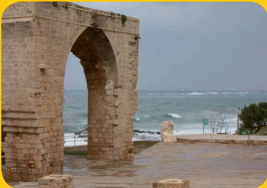
שרידי מבצר צלבני