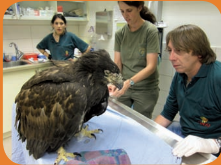
מישהו מטפל בך - גוזל העיטם זוכה לטיפול מסור בבית החולים לחיות בר

איך נעלם העיטם לבן הזנב מנופי ארצנו, מה עשו ברשות הטבע כדי להשיבו, וכמה אהבה ודאגה מושך אליו גוזל קטן שחלה