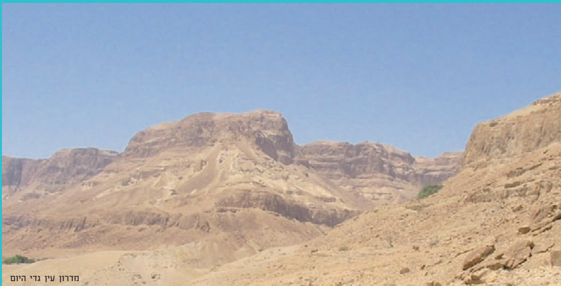
מדרון עין גדי היום