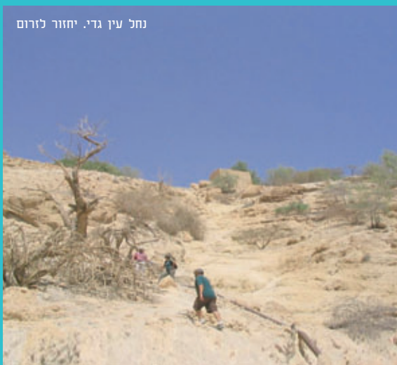
נחל עין גדי. יחזור לזרום

שמורת עין גדי היא אי של סוואנה המוקף במדבר קיצוני ושוכן לחופו המערבי של ים המלח. התנאים האקולוגיים הייחודיים שלה הופכים אותה לבית גידול של צמחים נדירים ובעלי חיים מדבריים מסוגים שונים. המים, מקור החיים של השמורה, מגיעים משני מקורות עיקריים: הנחלים ערוגות ודוד ומעיינות עין גדי ושולמית. אלא שעד כה, היו המים נתפסים במעלה הנחל או בנביעת המעיינות, ומופנים אל הקיבוץ שאחד ממפעליו הידועים הוא זה של המים המינרליים. ההסכם שנחתם כעת משנה את אופן חלוקת המים באזור המעיינות, כך שרק 25 אחוז מהם יישמשו את הקיבוץ וחלקם הגדול (75 אחוז) יוחזר לטבע. בנווה המדבר עין גדי, אלפי קילומטרים מאזור תפוצתם השכיח, גדלים עצים, שיחים ומטפסים סודניים שזהו הקצה הצפוני של תחום גידולם. אנב, זהו רק מרכיב אחד במערכת אקולוגית ייחודית, שכן מינים נדירים רבים נמנים עם צמחי האזור. בין הצמחים הטרופיים של עין גדי נמצא גם את השיזף המצוי ואת עצי ערף המדבר, שריכוז גדול שלהם מצוי בשמורה. גם בעלי החיים המתקיימים בעין גדי מייצגים את מגוון המינים המדברי - מהנמר ועד הקוצן.