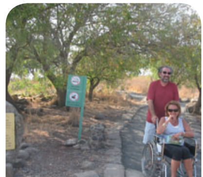
שביל הנכים בגמלא

הראם הלבן נעלם מנוף ארצנו בשנות הארבעים של המאה הקודמת וגם בעולם הוא נמצא בסכנת הכחדה. בישראל הוא נראה לאחרונה בשנת 1944 על ידי סרג'נט בריטי ששירת במשטרת עין חוצוב - חצבה של היום. בשנות השבעים המאוחרות הגיעו לארץ מספר ראמים מסן דייגו ושוכנו בחיבר יטבתה לצורך גרעין רבייה. הפרויקט הצליח והראמים אכן התרבו באופן מרשים. בשנת 1997 שוחררה קבוצת ראמים ראשונה באזור חצבה. כיום מעריכים ברשות הטבע והגנים כי ברחבי הנגב חיים כ-80 ראמים.