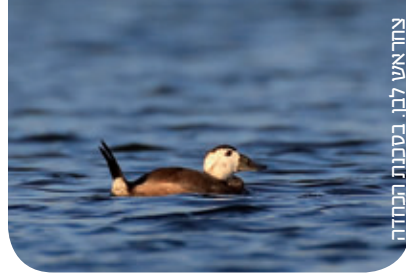
צוחאש לבן, בסכנת הכחדה