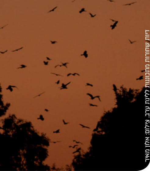
דיות שחורות מתכוננות ללית ערב