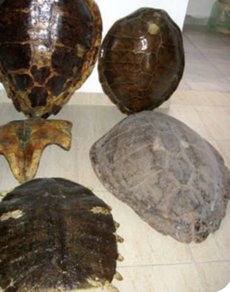
שריוני צבי ים שנתפסו בביתו של עבריין.