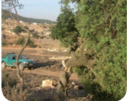
כריתת אלונים בשמורת הר מירון-גלב