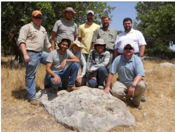
משלחת הסקר האזורי של תל גזר ליד כתובת מס' 4 (הישנה שהתגלתה מחדש).