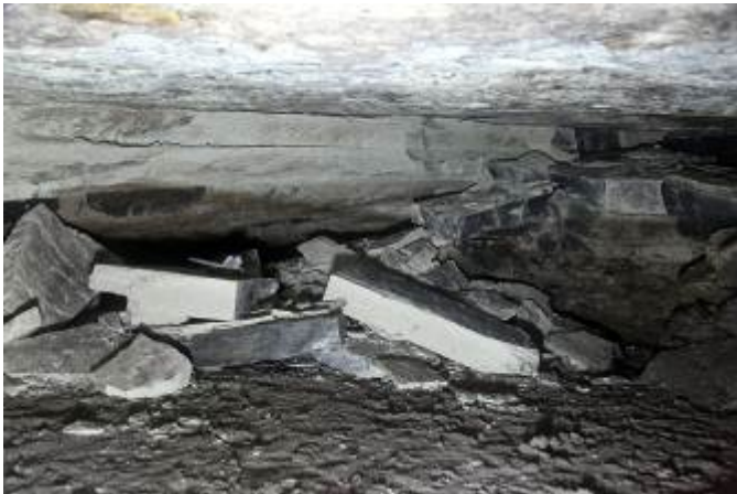
מימין: תכנית וחתך של מפעל המים כפי ששרטט מקליסטר. המערה הטבעית היא קטע ד. משמאל: צילום של המערה הטבעית. שימו לב לדמיון של גושי האבן בין הצילום לחתך.

בעונת החפירות הבאה שתתקיים במאי-יוני 2013 מתוכנן להסיר את ה'ריצוף' ולחפור אל מפלס מי התהום הקדום במילוי קדום שלא נחפר על ידי מקליסטר.