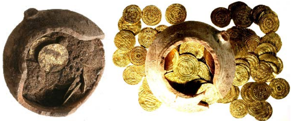
הפכית והמטמון.

טביעת המטבעות נעשתה באלכסנדריה והן מתוארכות לתקופה הפאטימית המאות ה-10-11 לספירה. משקל המטמון כ-400 גרם זהב טהור, ומצב ההשתמרות מצויין – איך לא (כן, הכל זהב).